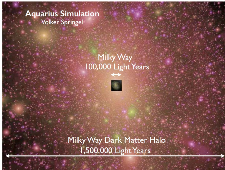
Figura 3: Como outras galáxias no universo do MPC, a Via Láctea ( Milky Way ) também deve possuir um enorme halo (aproximadamente) esférico de matéria escura. O diâmetro de tal halo é 15 vezes maior que o diâmetro da Via Láctea visível no céu (diâmetro de 100.000 anos luz), o que corresponde a um volume escuro 15^3 \approx 4.000 vezes maior do que a Via Láctea luminosa. Isto é o que indicam as simulações do MPC [4].

Como pode ser visto na Fig. 3, o halo da Via Láctea possui muitos sub-halos. Tais sub-halos são as sementes para a formação de galáxias satélites da Via Láctea. A matéria escura não bariônica funciona, no receituário do MPC, como o esqueleto subjacente a todas as estruturas de matéria bariônica, as quais são as galáxias propriamente ditas. Isto funciona da seguinte forma, no caso dos halos e sub-halos escuros: os halos são poços de potencial gravitacional de matéria não bariônica, nos quais a matéria bariônica cai e é acumulada, resultando, pelo seu próprio colapso gravitacional, na formação de estrelas e galáxias. é neste sentido, portanto, que dizemos que os halos escuros são as sementes para a formação das galáxias .