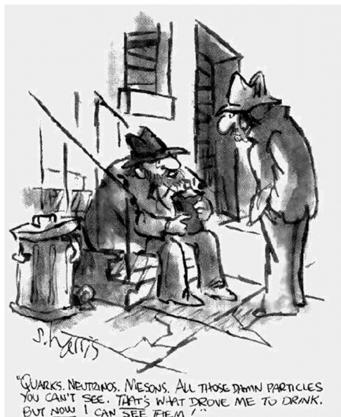
Figura 4: O nosso amigo bêbado tem dificuldade em aceitar as realizações da ciência contemporânea. Ele diz “— Quarks, neutrinos, mésons. Todas aquelas malditas partícula que não podemos ver. É isto que me levou a beber. Mas agora eu posso vê-las. ” [4].

De certa forma, o bêbado da Fig. 4 está equivocado, pois as partículas que ele enumera nós as podemos “ver”, i.e., as suas existências já foram comprovadas experimentalmente. No entanto, ele não deixará de encontrar motivos para beber: existem inúmeras partículas “escuras” à disposição no mercado, principalmente as hipotéticas partículas não bariônicas do MPC.